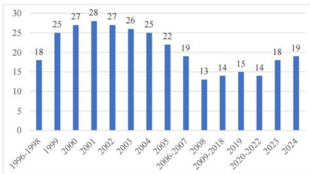
1-rasm. Aksiz osti tovarlari sonining o'zgarishi 2

Soliq stavkalari har kalendar yil uchun Prezident qarori bilan belgilanar edi. 2020 yildan boshlab, O'zbekiston Respublikasi Qonuniga asosan belgilanadi. Aksiz solig'i quyidagi tovarlarga nisbatan belgilangan: tamaki mahsulotlari, alkogol mahsulotlari va neft mahsulotlari. O'zbekiston Respublikasi Soliqlik kodeksining 289 3 -moddasiga muvofiq 2026-yilda Tamaki mahsulotlariga nisbatan soliq stavkalari quyidagi miqdorlarda belgilanadi.