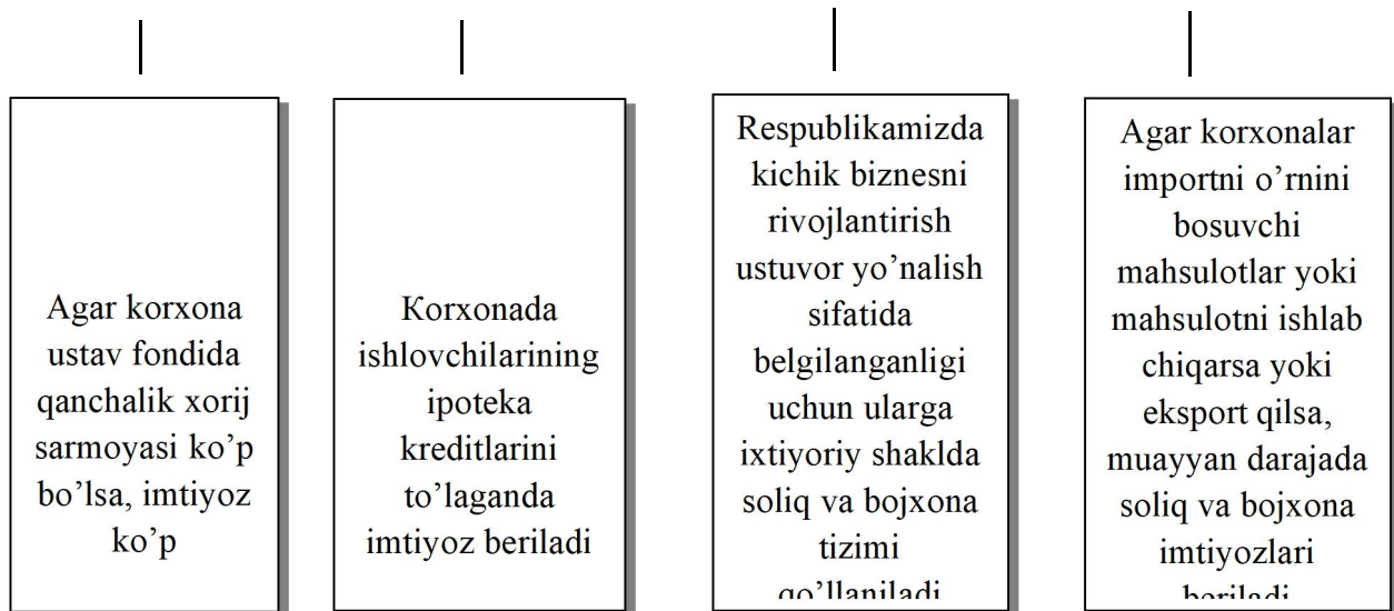
1-rasm. Soliq va bojxona imtiyozlarini belgilash mezonlari 1

1-rasmdan ko'rishimiz mumkinki, O'zbekiston Respublikasi soliq qonunchiligida soliq imtiyozlarini belgilash muayyan mezonlar asosida amalga oshirilgan. Soliq imtiyozlarini soliq to'lovchilarning investitsion mavqeyiga, ularning sotsial-ijtimoiy holatiga, respublikamizda qaysi sohani rivojlantirish ustuvorligiga, soliq to'lovchilarning importni o'rni bosadigan mahsulotlarni ishlab chiqarish darajasiga hamda davlatlar o'rtasidagi xalqaro iqtisodiy munosabatlarga asoslanib belgilangandir. Soliq va bojxona imtiyozlarini mezonlarini to'g'ri obyektiv aniqlash iqtisodiyotning adolatlilik tamoyili ifodasi sifatida yuzaga chiqadi.